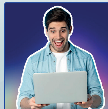
Numérique & IA